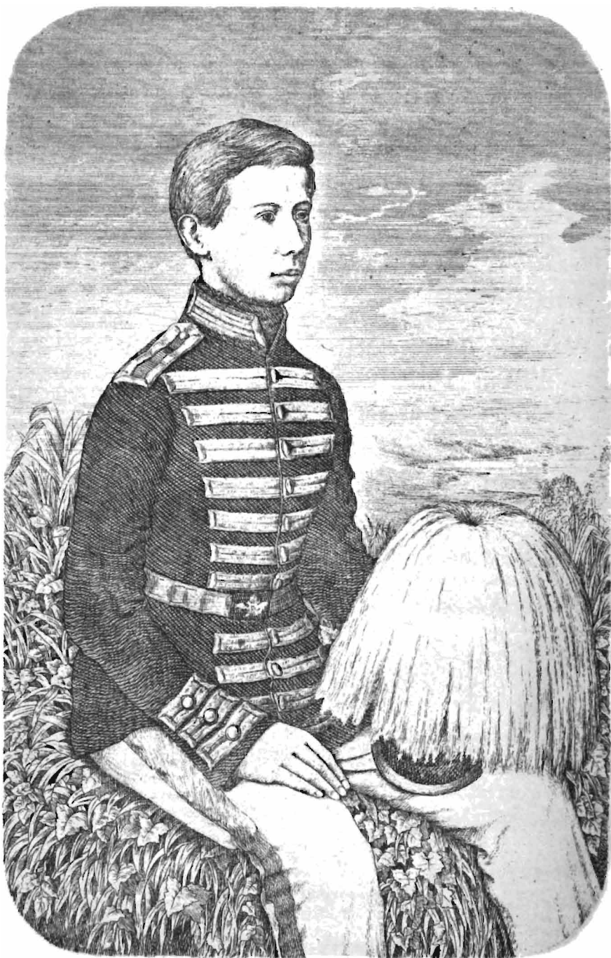
Каперо Паско Во страшной приоборной фронт. 1856 г.